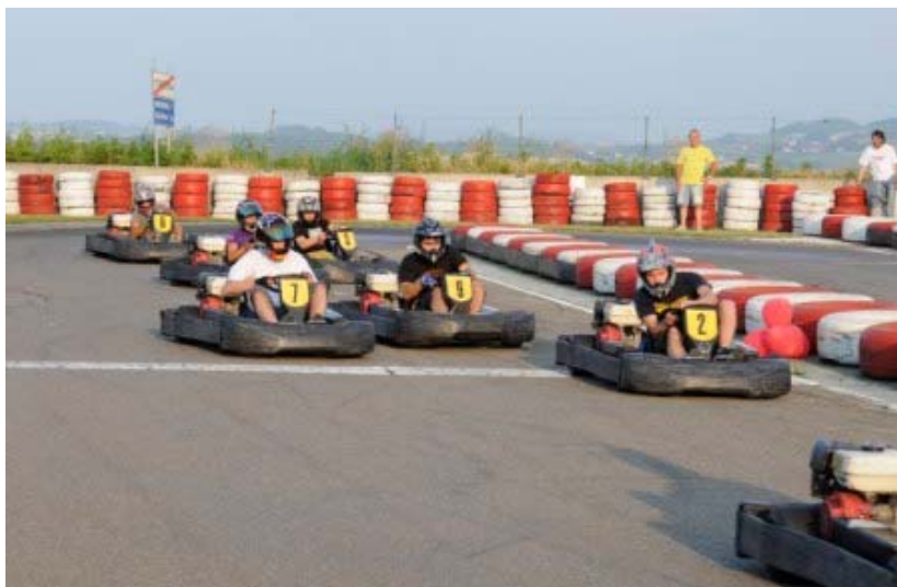
Sopra i piloti al via della gara

Un I Trofeo Endurance LA Capitania all'insegna del brivido adrenalinico contagioso.